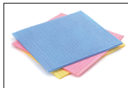
〈写真はイメージです〉